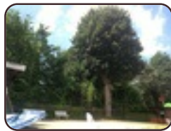
Acer pseudoplatanus 'Purpurascens' St.- Agatha - Berchem Basilieklaan, 14