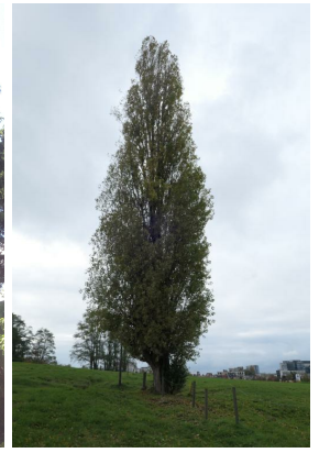
Italiaanse populier, Zavelenberg